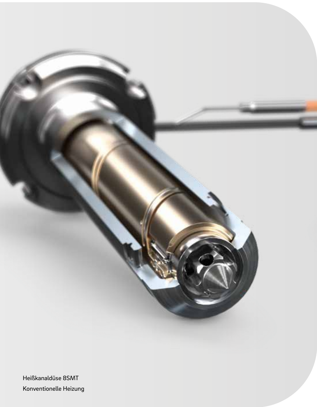
Heißkanaldüse 8SMT Konventionelle Heizung