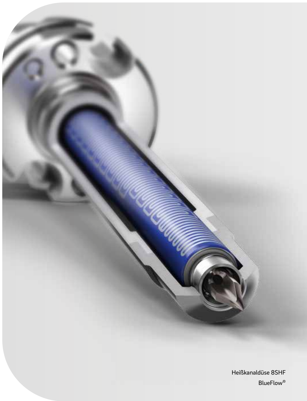
Heißkanaldüse 8SHF BlueFlow®